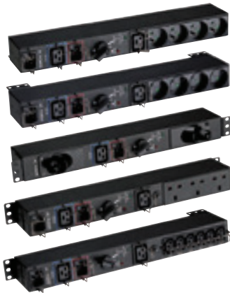
Gamme HotSwap MBP