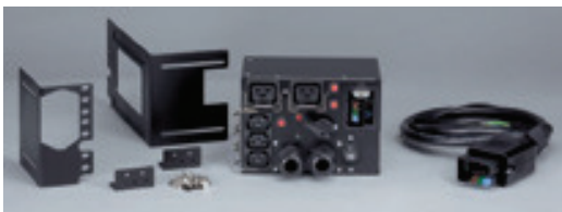
Hotswap MBP6Ki et MBP11ki