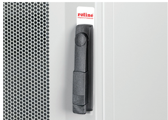
Fronttür mit Schwenkhebelgriff