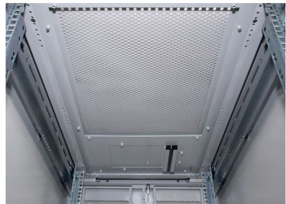
Dach mit Ausstanzungen für Belüftung