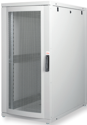
Fronttür aus 70% perforiertem Stahl