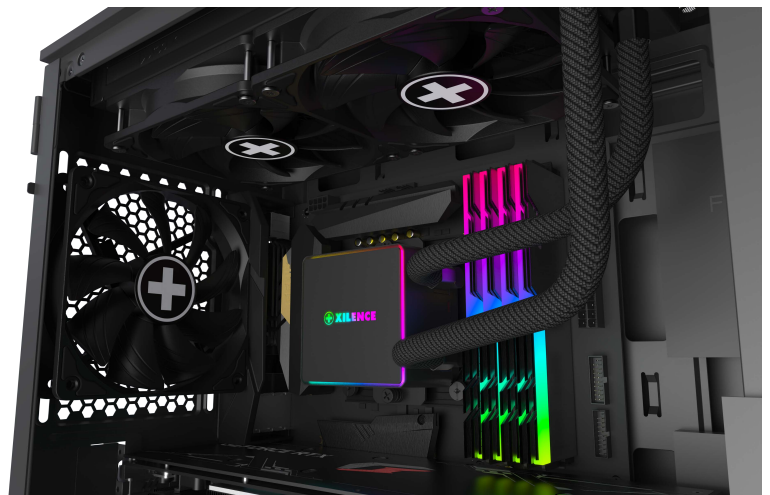
Voorbeeldweergave van het LQ240PRO waterkoelsysteem in een PC.