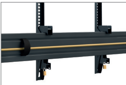
Kabelmanagement mittels Kabelclips