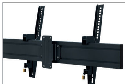
Anpassbar dank modularer Bauweise