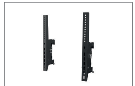
VESA max. 600 x 400 mm