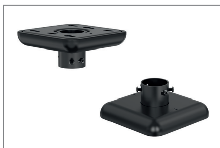
Sauberer Decken- und Bodenabschluss