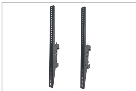
VESA max. 600 x 400 mm oder 400 x 600 mm

Die Komplettlösungen sind mit den Einzelkomponenten der comPROnents®-Serie uneingeschränkt kombinierbar und erweiterbar und bieten so weitere Einsatzmöglichkeiten.