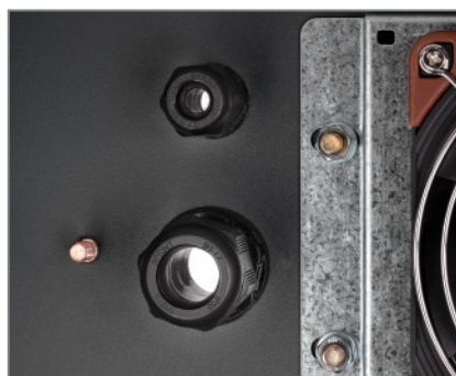
Kabeldurchführungen mit Dichtung