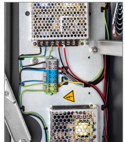
fachgerechte Verkabelung und Absicherung nach VDE (E-Check)