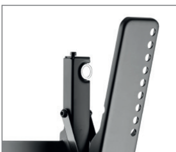
Höhenausgleich ±8 mm