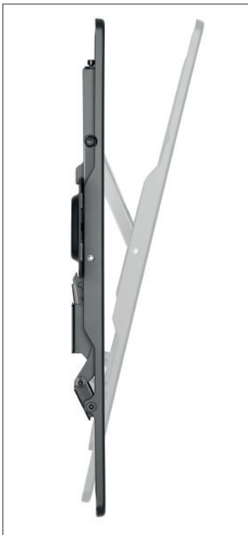
Neigungswinkel 0 bis -12°