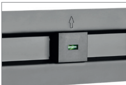
integrierte Wasserwaage für eine präzise Ausrichtung des Bildschirms