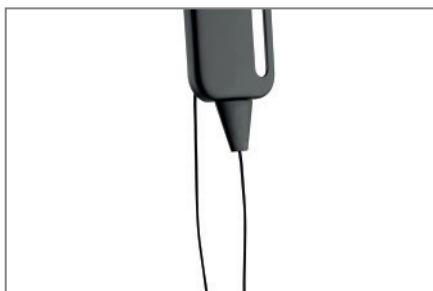
Lösevorrichtung mit Magneten unsichtbar an der Halterung arretierbar