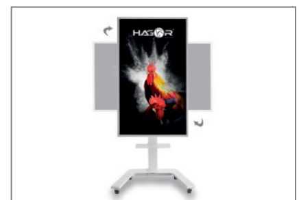
Wechsel der Ausrichtung ohne Entriegelung