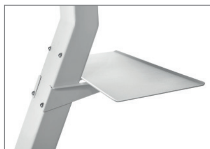
inkl. Ablage, optional verwendbar