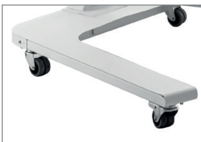
inkl. Rollenset, tw. feststellbar