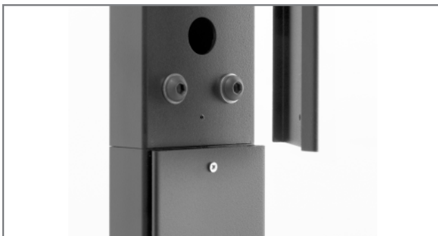
Kabelführung innerhalb des Rahmens und der Tragsäulen