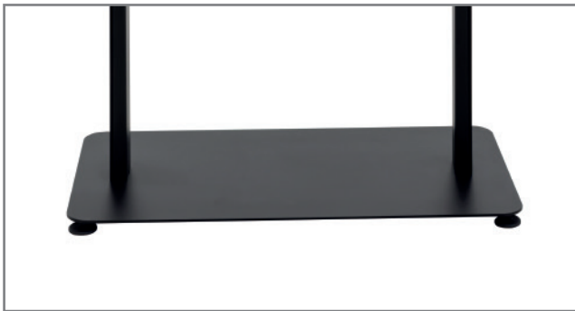
Kippsicherer Standfuß für flexible Positionierung im Raum

Alternativ steht auch eine Variante zur direkten Bodenmontage zur Verfügung. Floormount OM55N-D (Art.-Nr.: 1918)