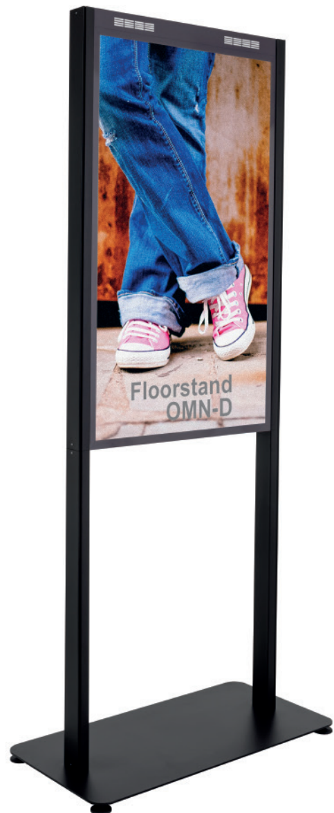
Technische Änderungen vorbehalten