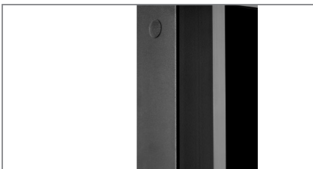
schlag- und kratzfeste Pulverbeschichtung