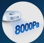
8.000 Pa Saugkraft