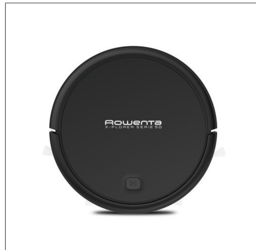
X-PLORER SERIE 50 RR7375WH Robot aspirapolvere RR7375WH